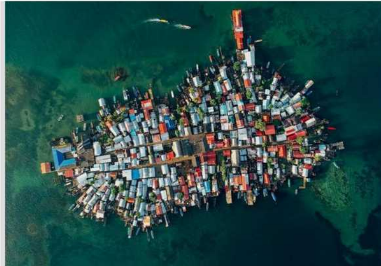
Rising Seas: las islas en peligro de extinción de Guna Yala, obra de Michael Adams

“A la vuelta del COVID-19, esperamos que nuestros artistas continúen trabajando por mejorar este mundo, así como que la percepción de todos sobre el arte y su función hagan que la protección de gobiernos e instituciones sea mayor. Porque, como está quedando demostrado: El arte salva”, concluyó Jiménez.