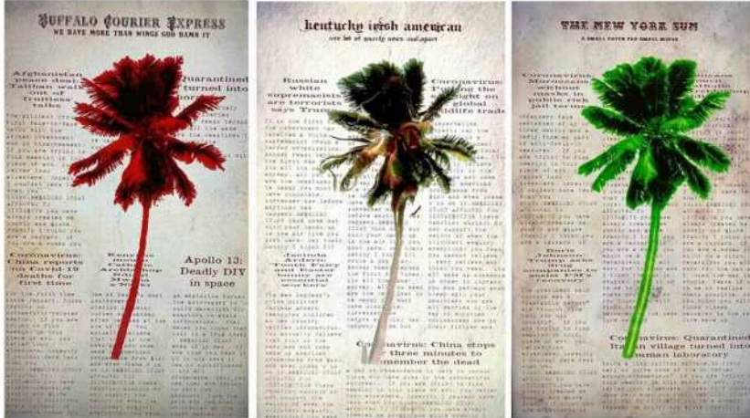
Proof of life, de Claudio Castillo. CORTESÍA

07 DE ABRIL DE 2020 10:40 PM, ACTUALIZADO 8 HORAS 47 MINUTOS ATRAS